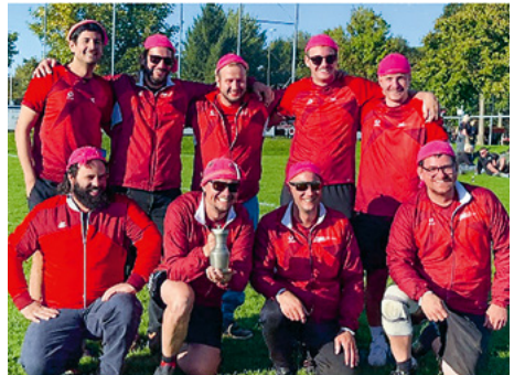
TV Schwarzenburg 3