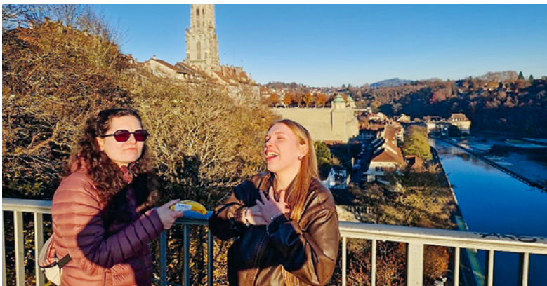
Macht ein Foto mit einer Brücke, der Aare, dem Münster und einer Banane