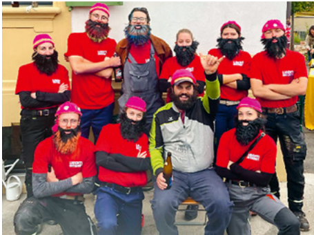
TV Schwarzenburg 2